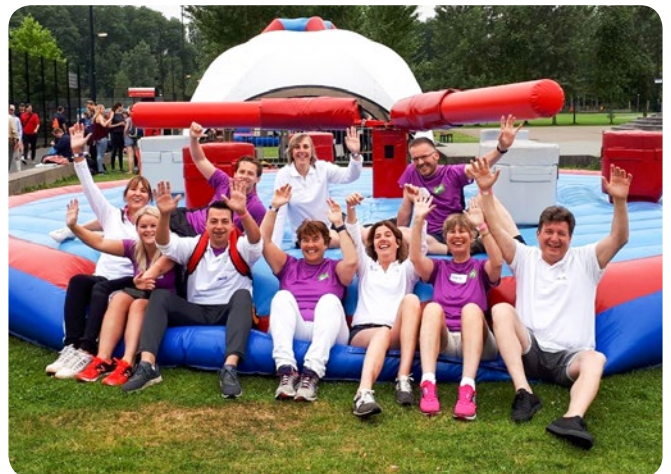
Olympische Sportweek Rotterdam