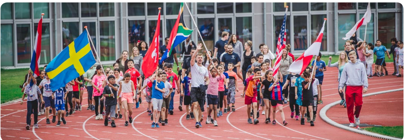
Olympische Sportweek Amsterdam