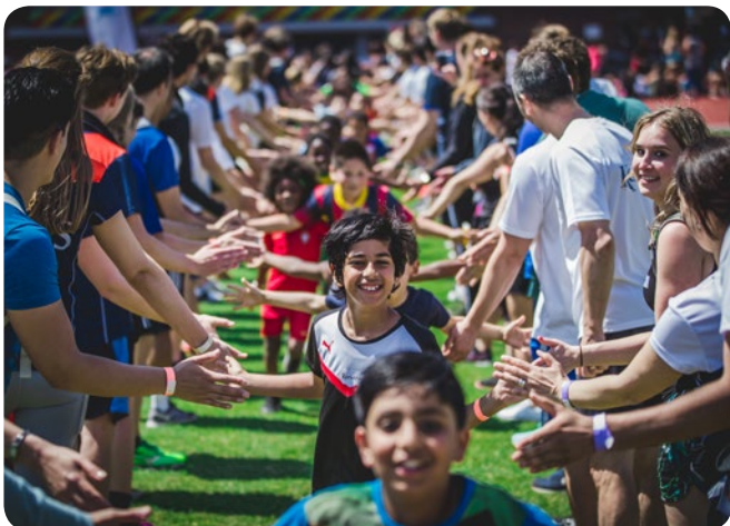
Olympische Sportweek Amsterdam