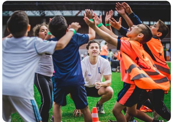
Olympische Sportweek Amsterdam