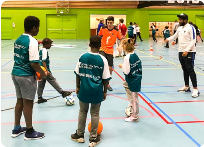
I-Sport Special evenement