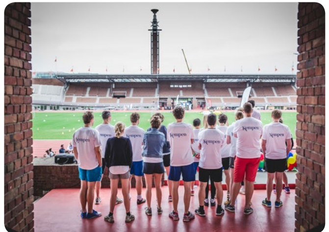
Olympische Sportweek Amsterdam