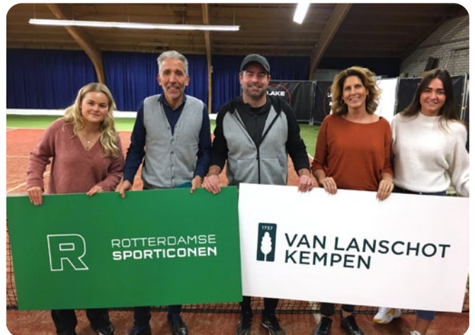
Stichting Rotterdamse Sporticonen