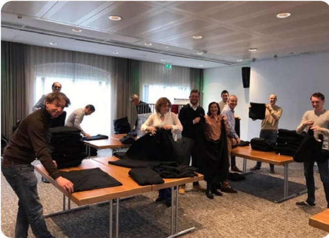
Dekentjes Kerstconcert verzamelen voor het Leger des Heils