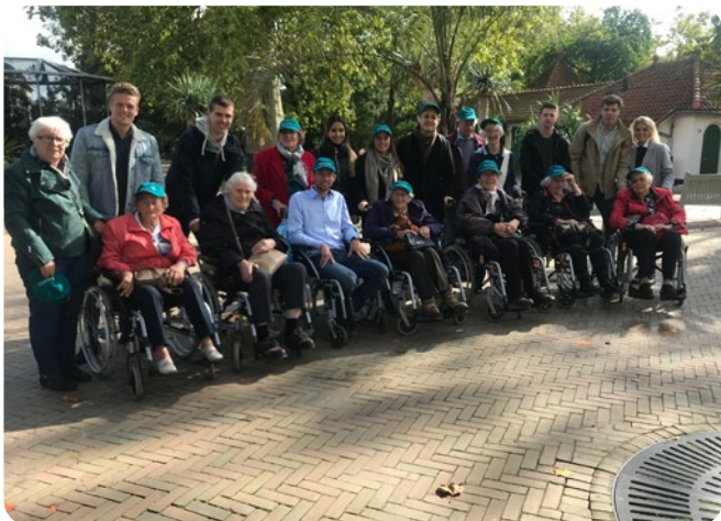
Uitje de Zonnebloem