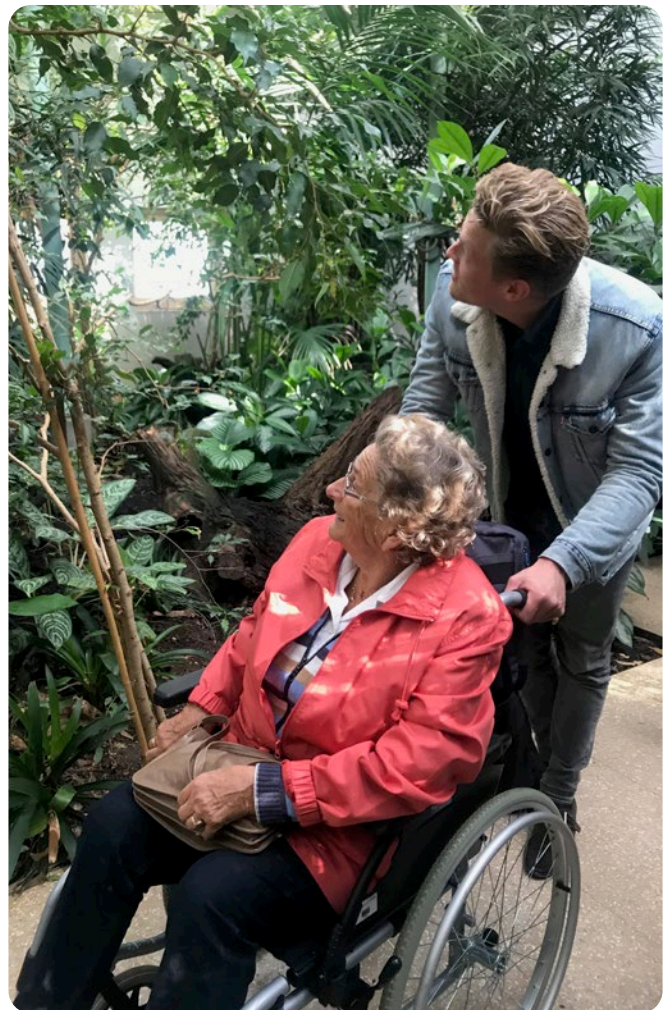
Uitje de Zonnebloem