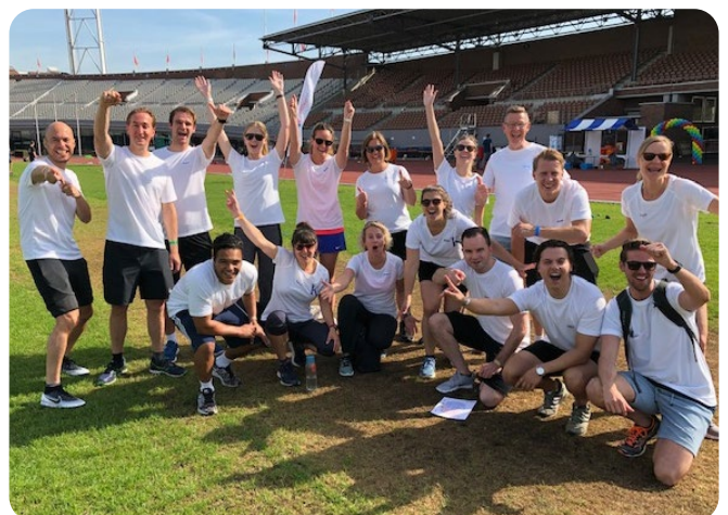
Olympische Sportweek Amsterdam