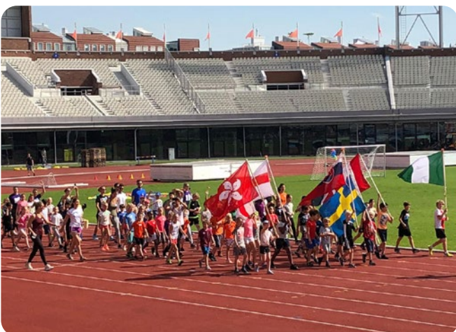
Olympische Sportweek Amsterdam