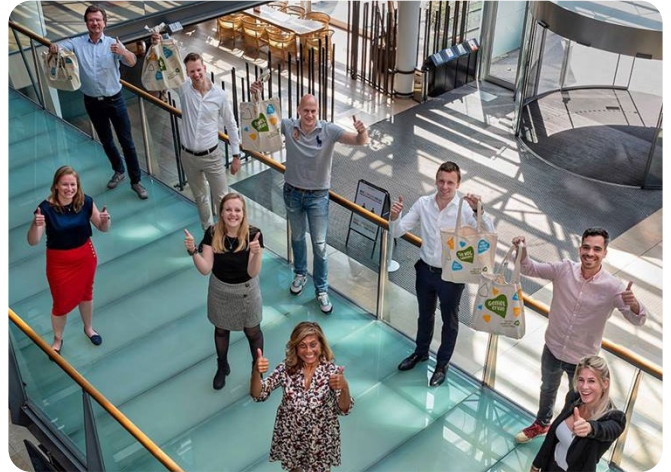
Hart voor de Zorg