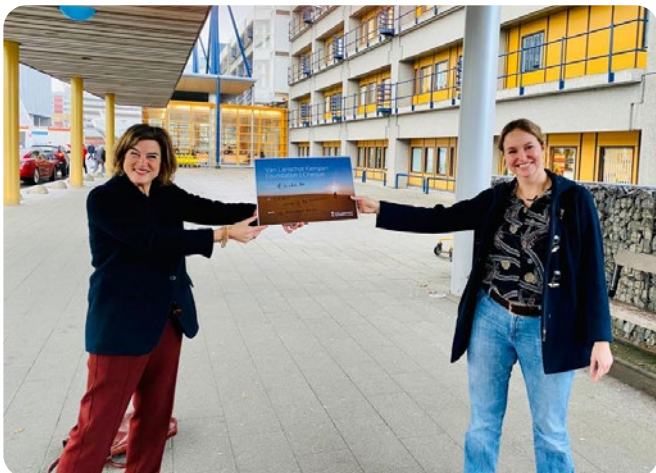
Corona-actie: overhandiging cheque aan LUMC