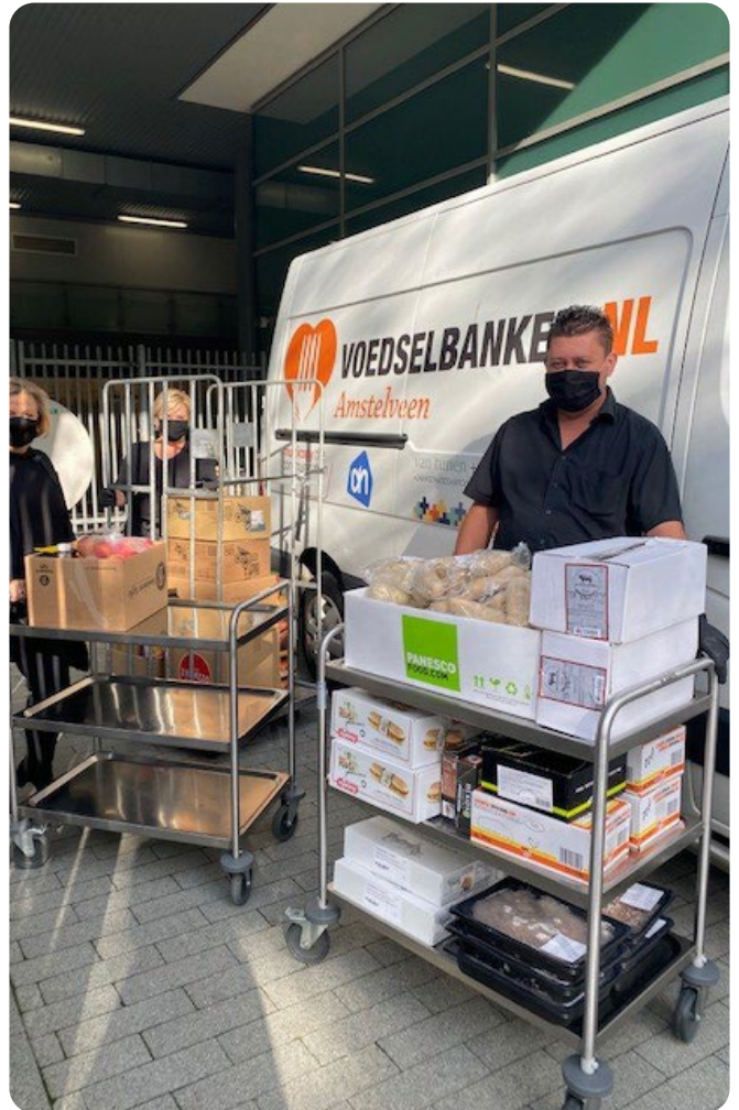
Donatie cateringvoorraad aan Voedselbank Amstelveen