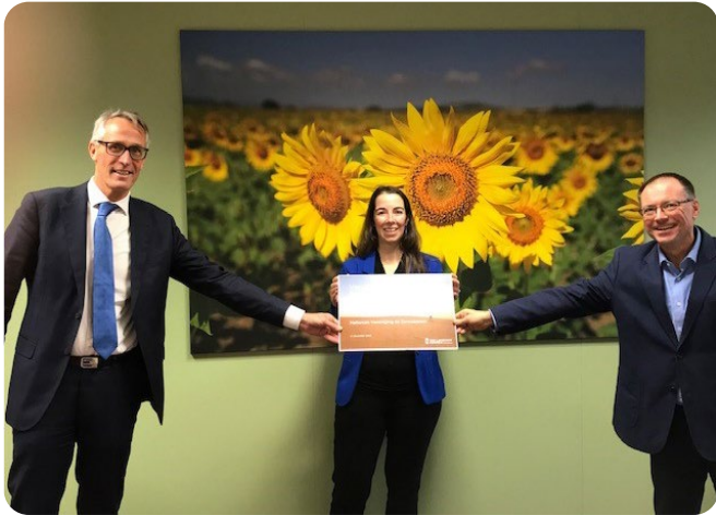
Corona-actie: overhandiging cheque aan De Zonnebloem