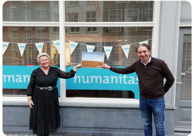
Corona-actie: overhandiging cheque aan Humanitas