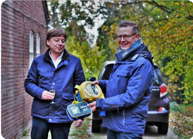
200 e AED in de gemeente 's-Hertogenbosch