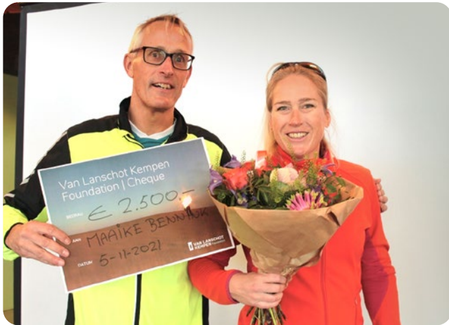
Hardloopevenement Blind vertrouwen