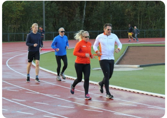
Hardloopevenement Blind vertrouwen