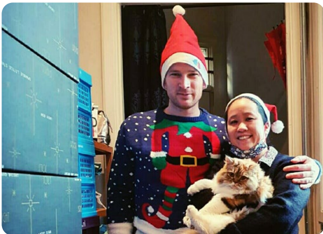
Kinderkerstpakkettenactie Den Haag