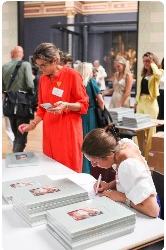
Kunstfotografieboek F|Fort Foundation