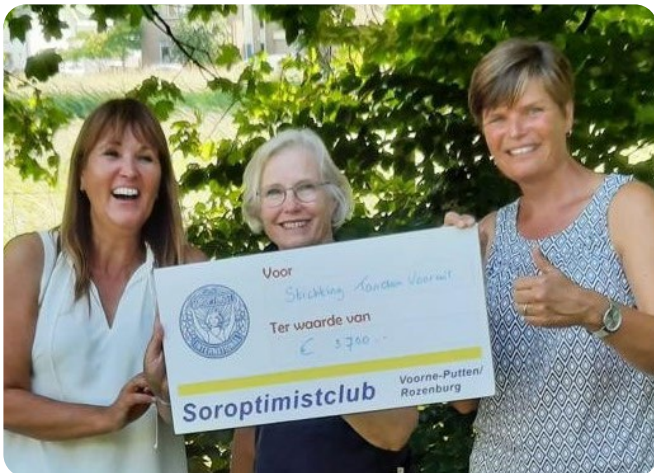
Stichting Tandem Vooruit