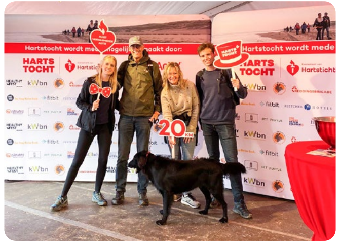
Wandel- en hardloopevent Hartstocht