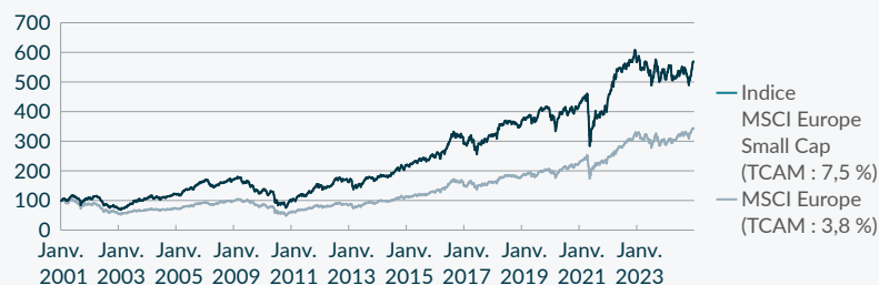
Graphique 1 : Une nette surperformance à long terme : MSCI Europe Small Cap vs. MSCI Europe