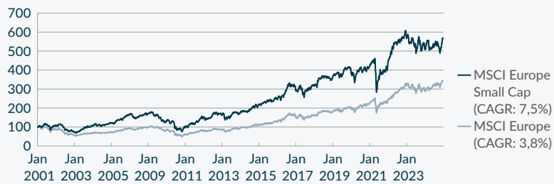
Grafik 1: Erhebliche langfristige Outperformance: MSCI Europe Small Cap gegenüber MSCI Europe