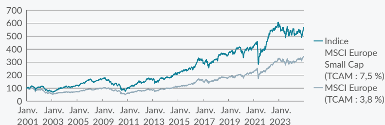
Graphique 1 : Une nette surperformance à long terme : MSCI Europe Small Cap vs. MSCI Europe